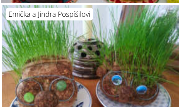
Emička a Jindra Pospíšilovi

Obecní zpravodaj vydává Obec Nová Telib, 294 06 Nová Telib, IČO: 00508951