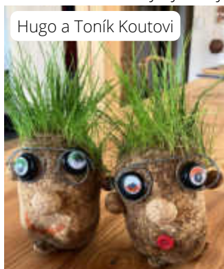
Hugo a Toník Koutovi

Dne 19.3.2025 se na Telibi konalo další tvoření, kde si děti vyrobily vlasáče. Ze sálu si je odnášeli holohlavé, ale každému vlasy vyrostly, podívejte!